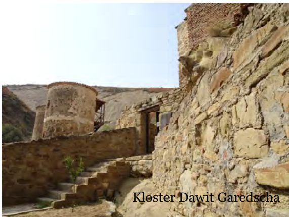
Kloster Dawit Garetscha

Der dritte Tag begann mit einer Fahrt in die Halbwüste an der Grenze zu Aserbeidschan zum Kloster Dawit Garetscha. Von der teilweise schwer zugänglichen Anlage von 13 Höhlenklöstern, im 11./12.Jh. kulturelles Zentrum Ost-Georgiens, sahen wir nur einen kleineren Teil. Ein wenigstens gleich beeindruckendes Erlebnis war die Rast in Udabno, einem Ort in „nowhere-land“, wo ein Pole ein Café, zum Teil aus Paletten gebaut, mit dem schönen Namen „Oasis“ eingerichtet hatte und wir neben einem