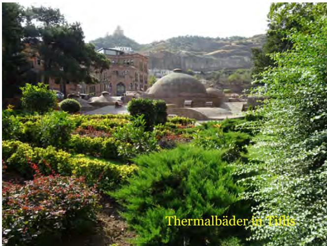
Thermalbäder in Tiflis

Unsere 10-tägige Rundreise durch Georgien startete in Tiflis, wo wir nach unserem Flug über Istanbul gegen Abend im sehr schönen Rooms Hotel eincheckten. Ein Stadtrundgang führte uns am nächsten Tag in die Altstadt mit den wichtigsten Denkmälern und zu den Thermalbädern mit ihren charakteristischen Ziegelkuppeln, von denen Puschkin sagte: „Nicht in Russland, nicht bei den Türken, fand ich, seit ich lebe, köstlicheres als Tiflis' Bäder.“ Von der seit dem 4. Jh. angelegten und nach einer Zerstörung 1827 weitgehend wieder aufgebauten Narikala Festung hatten wir einen großartigen Blick über die Stadt mit ihren ca. 1,4 Millionen Einwohnern, nachdem wir zuvor schon das Mittagessen in einem Restaurant am Steilhang des Flusses eingenommen hatten, das von der Gegenseite den Blick über die Stadt erlaubte.