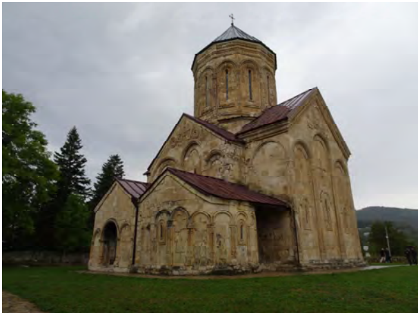
N I K O R Z M I N D A

Regen hinderte uns nicht daran, das abseits gelegene und deshalb von Reisegruppen nur selten besuchte Nikorzminda aufzusuchen, eine Klosterkirche, deren bauplastische Ausgestaltung ihresgleichen in Georgien sucht.